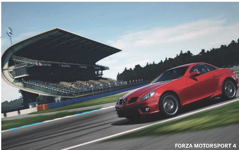
FORZA MOTORSPORT 4

Sessantamila i partecipanti attesi, oltre 30 gli espositori - tra produttori di console ed editori di videogames - e più di 120 i prodotti in vetrina, per un evento unico che garantisce un'esperienza di divertimento a 360 gradi, per impallinati e non; tra i padiglioni della fiera sarà infatti possibile provare in anteprima le novità più attese